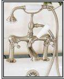
Agujeros en el borde