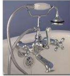
Agujeros por dentro