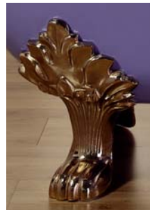
Pata modelo bola Pata modelo colonial