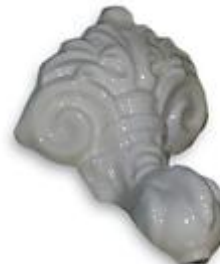
Pata esmaltada en porcelana