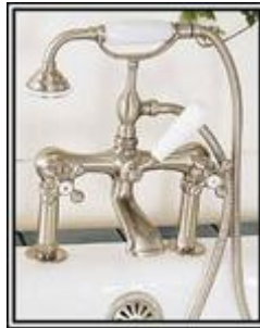
Agujeros en el borde